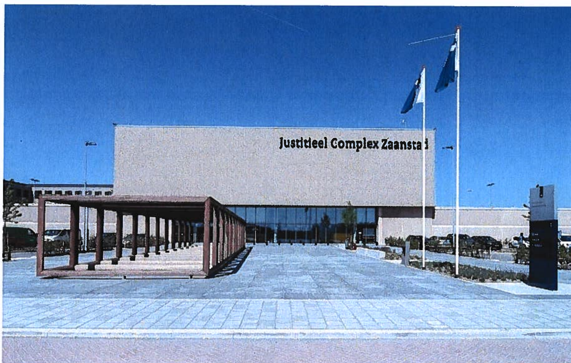
Afbeelding afkomstig uit de digitale nieuwsbrief van het J.C. Zaanstad