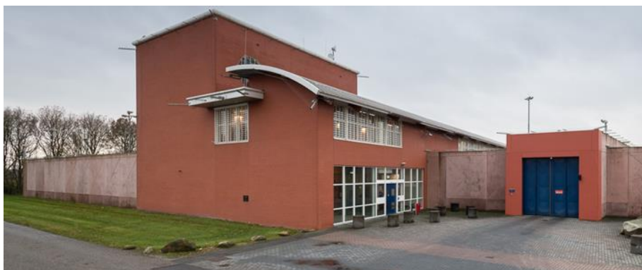
Inrichting: P.I. Ter Apel

PI Ter Apel Postbus 69 9560 AB TER APEL tel. 088 07 42100