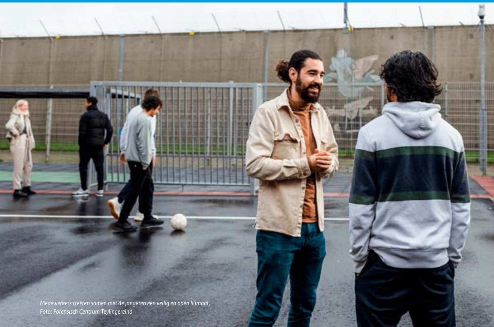
Medewerkers creëren samen met de jongeren een veilig en open klimaat.