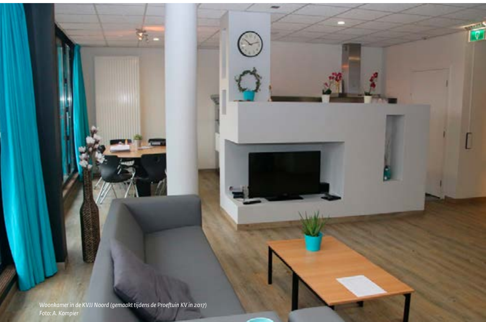
Woonkamer in de KVJJ Noord (gemaakt tijdens de Proeftuin KV in 2017)

De Kleinschalige Voorziening Justitiële Jeugd (KVJJ) Noord wordt gehuisvest in een vrijstaande unit van Elker Jeugdhulp & onderwijs. Die ligt in een woonwijk in het noorden van de stad Groningen. In 2017 was op deze plek ook de Proeftuin Kleinschalige Voorziening . Er is plaats voor 8 jongeren, van first offenders tot jongeren in de laatste fase van een PIJ-maatregel. Maar ook jongeren die bijvoorbeeld hun taakstraf niet hebben afgemaakt, kunnen in de