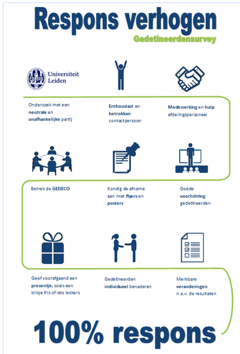
Figuur 1. Infographic met maatregelen om de respons te verhogen 6

Dit onderzoek heeft zoveel mogelijk gebruik gemaakt van eerder opgedane kennis over vragenlijstonderzoek in penitentiaire inrichtingen. In Figuur 1 is een infographic weergegeven, met zogenaamde respons verhogende maatregelen, die in dit onderzoek zijn toegepast.